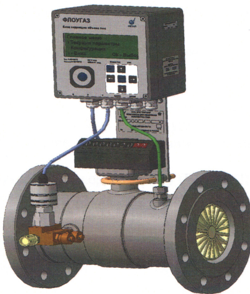
Рисунок 1 - Общий вид комплекса для измерения количества газа КИ-СТГ

По требованию заказчика комплексы могут комплектоваться дополнительным средством измерения перепада давления на счетчике.