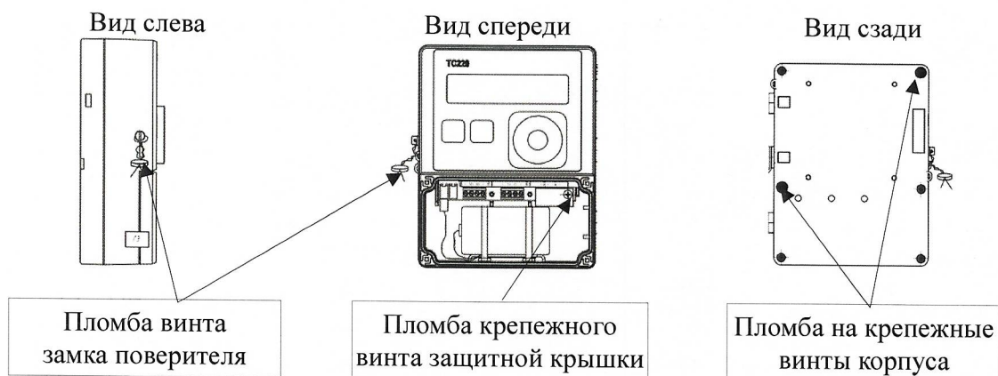
Рисунок 3 – Места нанесения знака поверки