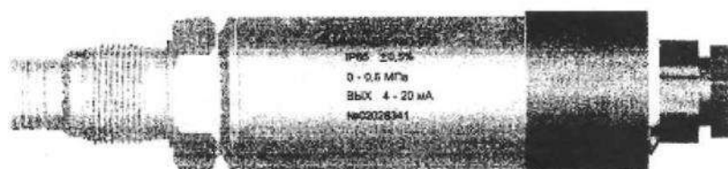
Рисунок 2 - Датчик избыточного давления МИДА-ДИ-12П-072