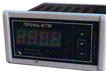
Фото 1. Фотография общего вида измерителя щитового исполнения ПРОМА-ИТМ-Ш

Фотографии общего вида измерителей приведены на фото 1,2,3,4.