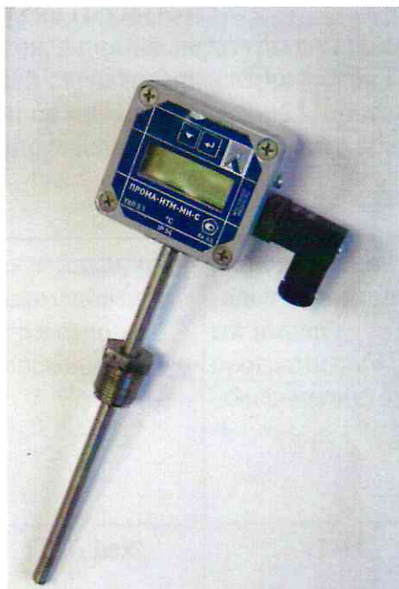
Фото 4. Фотография общего вида измерителя ПРОМА-ИТМ-МИ-С.