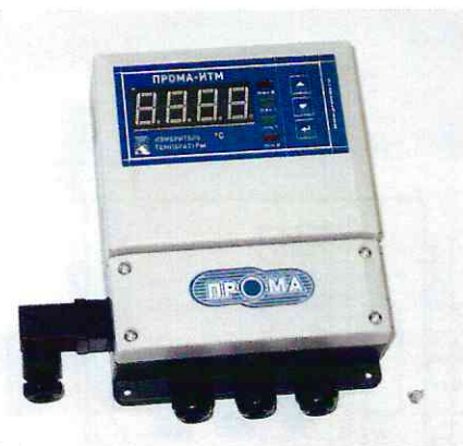
Фото 2. Фотография общего вида измерителя настенного исполнения ПРОМА-ИТМ-Н.