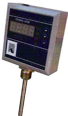
Фото 3. Фотография общего вида измерителя для установки на трубопровод ПРОМА-ИТМ-Р.